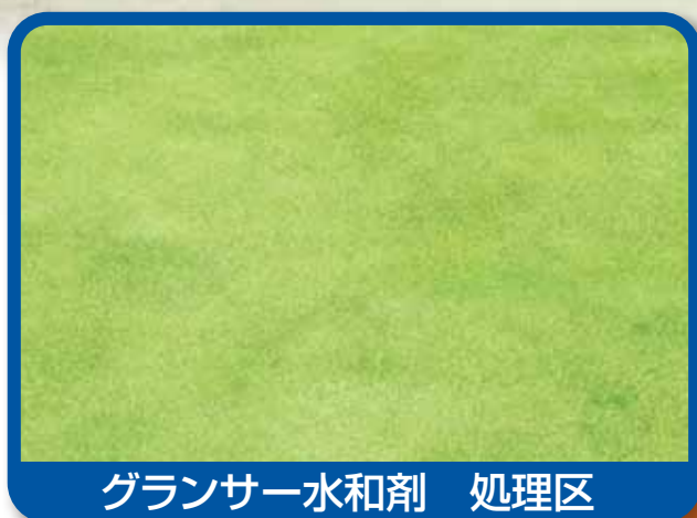
グランサー水和剤 処理区